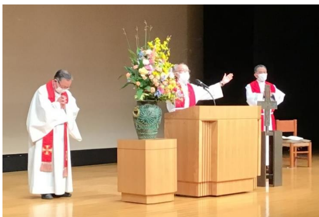
竹田牧師、徳弘牧師、明比牧師による開会礼拝