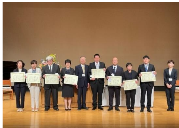
10 年、20 年永年勤続表彰